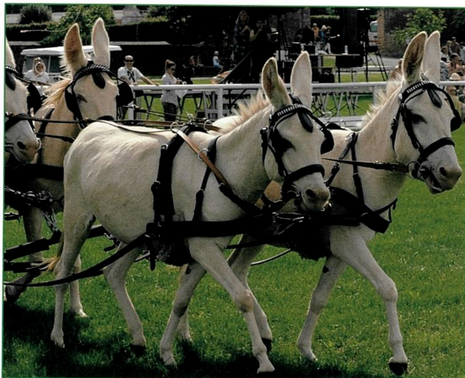
Selbst als Sechsspänner können die Esel von Schloss Hof präsentiert werden

Ein Esel prüft für sich selbst ob er gewisse Situationen oder Strukturen als gefährlich einstuft. Dieses „Prüfen“ nimmt eine gewisse Zeit in Anspruch, die man dem Esel auch zugestehen sollte, entspricht sie doch so ganz seiner Biologie. Mit der notwendigen Ruhe, Geduld und positiven Verstärkung lernt der Esel gerne Neues. Darf ein Esel sich die Zeit nehmen um Neues zu „verstehen“ wird sich der Lernerfolg sehr bald einstellen. Einmal Gelerntes kann dann auch nach langer Pause meist sofort wieder abgerufen werden.