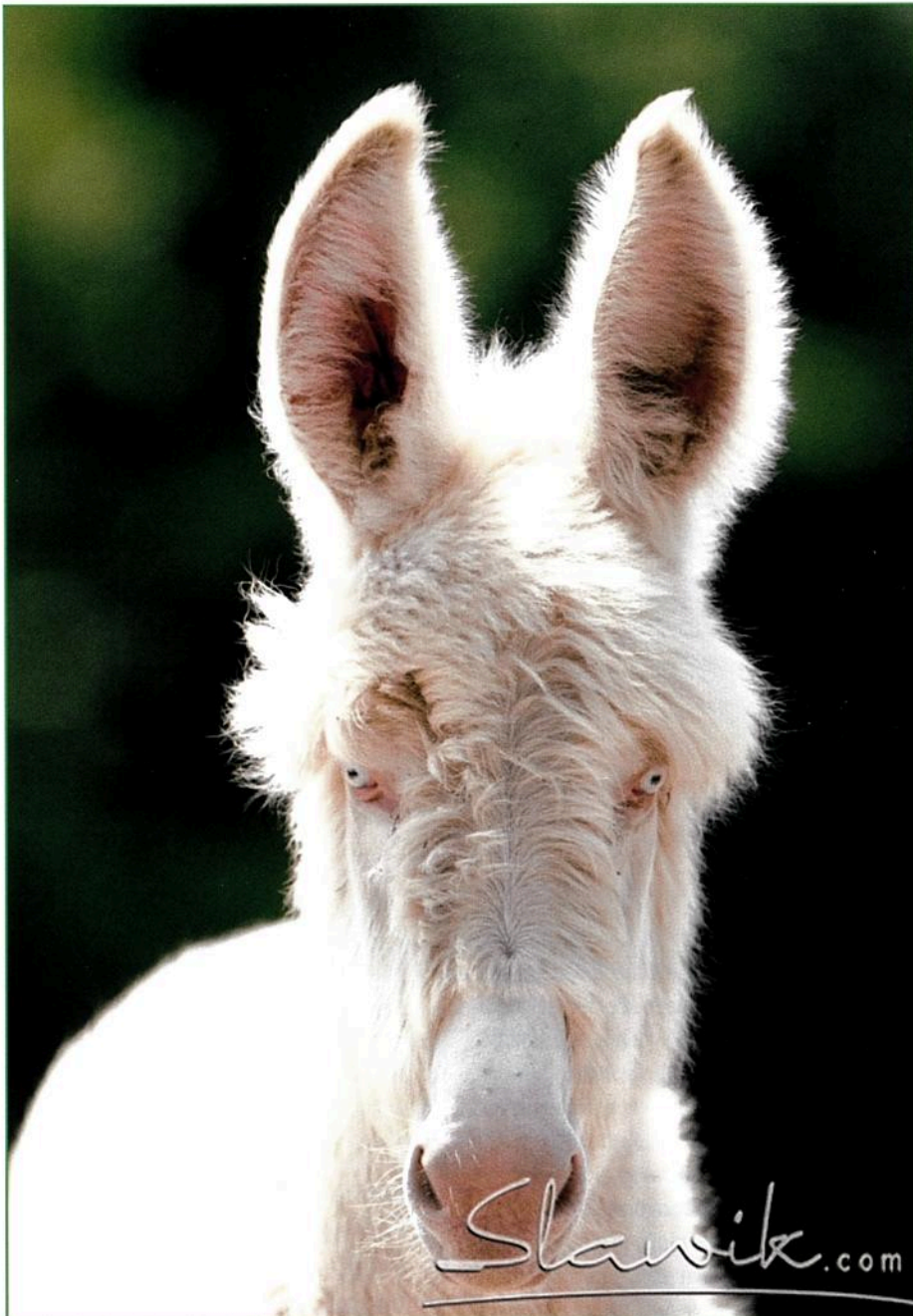
Die weißen Esel haben die Sympathie der Fotografen gefunden

Training für diese Shownummer kam es durchaus zu einer gewissen Wettkampfstimmung zwischen dem Team Pferd und dem Team Esel und der großen Frage ob das ehrgeizige Unterfangen bis zum Festtag auch gelingen würde. Wir hatten zwei Esel, die vor der Kutsche gingen und genügend Erfahrung mit Pferden. Nur merkten wir schnell, dass das Trainingsprogramm für ein Pferd nicht unbedingt passend für einen Esel ist. Nach vielen Versuchen lässt sich das darauf folgende Trainingskonzept allerdings in wenigen Sätzen zusammenfassen: mit viel Liebe und Geduld, auf die Bedürfnisse der Tiere eingehend, ist ALLES machbar und das in erstaunlich kurzer Zeit. Grundvoraus-