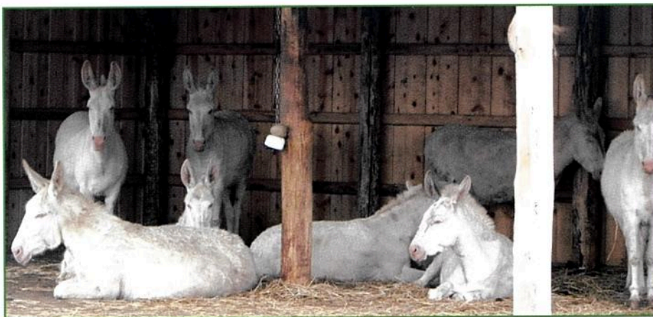
Die Eselherde von Schloss Hof, Foto: Archiv Schloss Hof

Pferde neigen in Stresssituationen zur Flucht, Esel bleiben oft wie angewurzelt