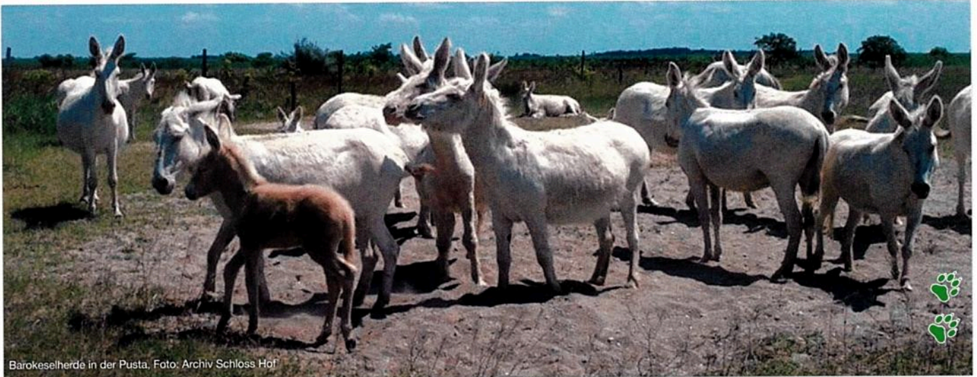
Barockeselherde in der Pusta.