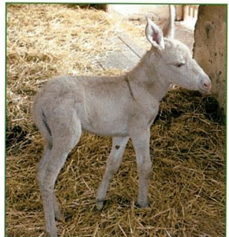
Barockeselfüllen "Franzi" in Schloss Hof.

Esel gehören zwar systematisch zur Familie der Pferde trotzdem sollte man auf gewisse Unterschiede zum Pferd eingehen. Ein Esel ist eben kein Pferd. Unterschiede